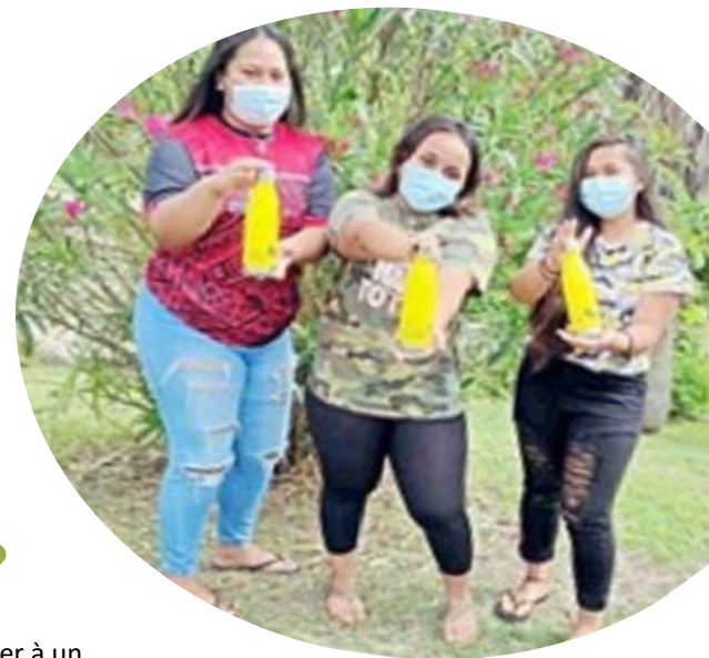
Des élèves du lycée Dick Ukeiwë, à la remise des gourdes, SERD 2021

87% des 52 élèves répondants souhaitent participer à un évènement lié au développement durable en 2022