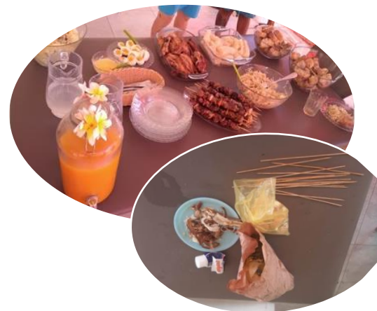
Au menu du pique-nique zéro déchet SERD 2021.