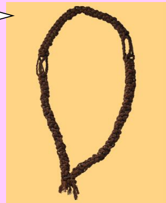
Ceinture de danse en fibres tressées

Période : Civilisation kanak traditionnelle Localisation : Ouvéa, Aire coutumière d'laii, -Calédonie Dimensions : Longueur 90cm