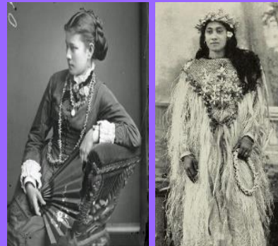
Princesses des Iles et parures