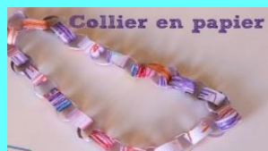
Collier en papier