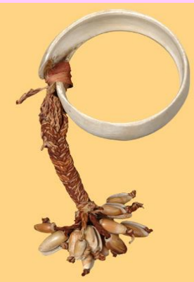
Bracelet kanak en cône

Œuvre 2 Bracelet kanak « bague de mariage »