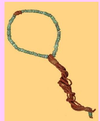
Collier kanak de perles de jade

Période : Civilisation kanak traditionnelle Localisation : Aire Djubea- Kaponé, Dimensions : Longueur 41cm Largeur 4cm