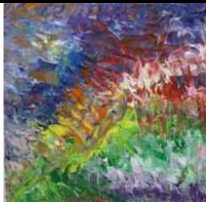
peinture au couteau