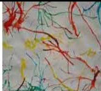
encre soufflée avec une paille