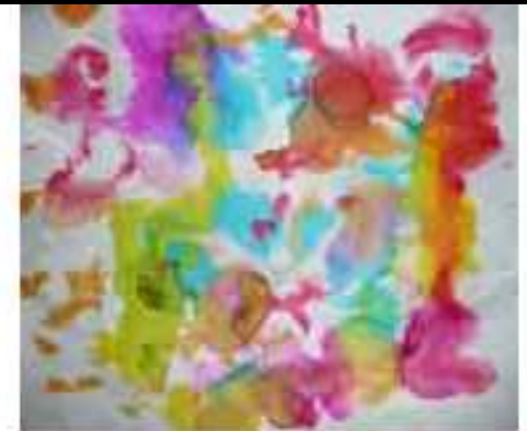
encre et papier mouillé