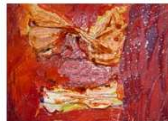
peinture en volume avec les bandes plâtrées