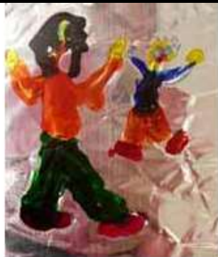
papier métallisé et peinture vitrail