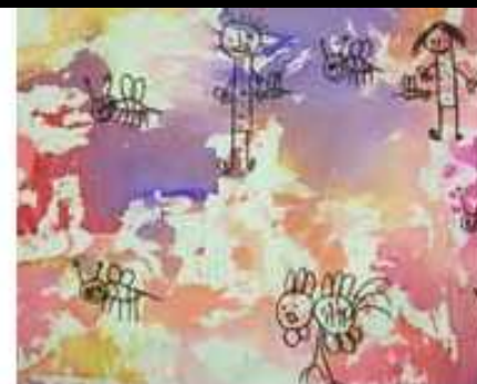
papier crépon mouillé