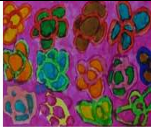
encres et acryliques