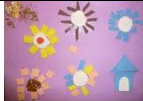
avec de la mousse