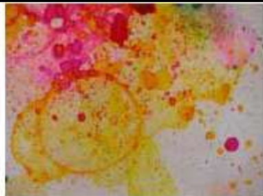
encre soufflée et liquide vaisselle