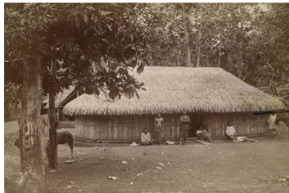
Tahiti : le faré