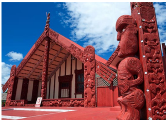
Nouvelle-Zélande : le marae