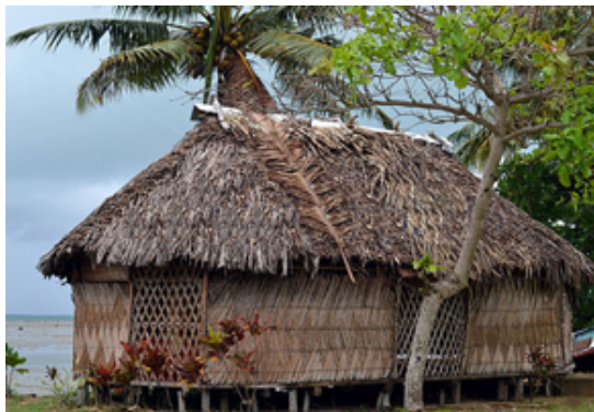
Wallis et Futuna : le falé fono